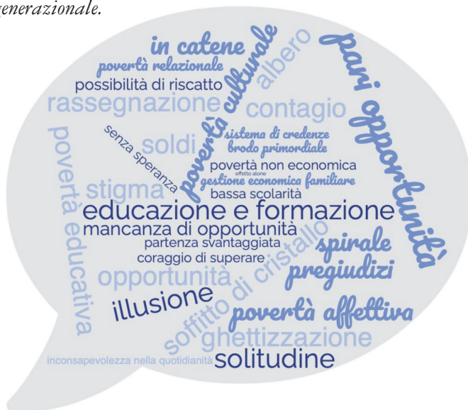
Figura 1. Le parole citate da operatori e volontari delle Caritas per definire la povertà intergenerazionale.

Gli operatori e i volontari delle Caritas lombarde hanno descritto la povertà intergenerazionale attraverso una parola evocativa. Emerge un quadro in cui prevale la rassegnazione dei beneficiari, la consapevolezza di operatori e volontari rispetto a quanto sia difficile spezzare la catena di trasmissione della povertà da una generazione all'altra.